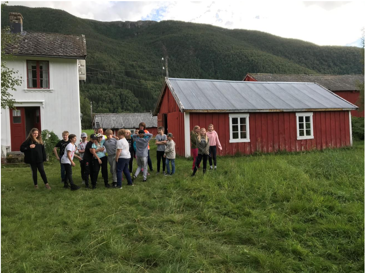
Elever på besøk på Gullbakkgården på Brenne.

Dks skal være med på å skape entusiasme i kulturbygda Saltdal, og bidra til å styrke den lokale tilhørigheten.